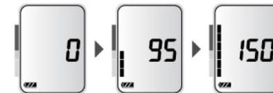
Процесс накачки манжеты