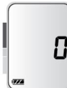
Прибор готов к измерению