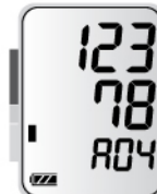
Среднее Давление за 4 измерения